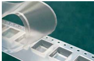
▲ キャリアテープ用カバー材