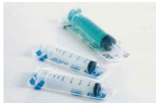
▲ ガンマ線滅菌対応 医療品包装