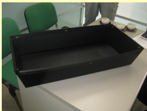
工場内部品搬送トレイ