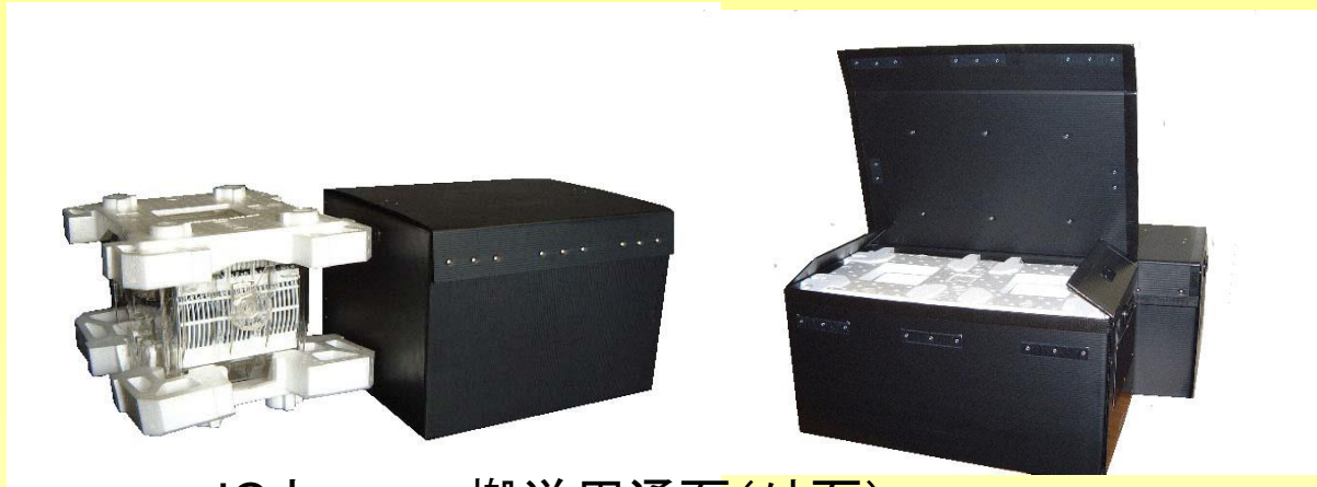
ICウエハー搬送用通函(外函)